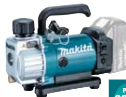
DVP180Z Bomba de vácuo 3.840 rpm 3,5 Kg