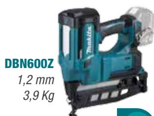
DBN600Z 1,2 mm 3,9 Kg