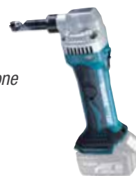
DJN161Z Roedora 1,2 mm 2,2 Kg