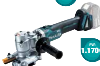
DSC250ZK Cortadora de varão 10-25 mm 3,9 Kg