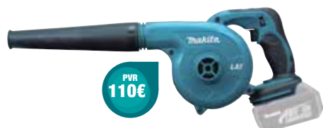
DUB182Z 0-18.000 rpm 2,6 m³/min 1,8 Kg