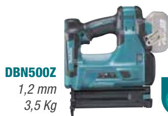
DBN500Z 1,2 mm 3,5 Kg