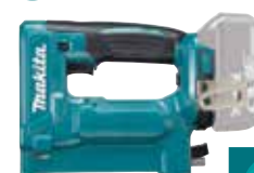
DST112Z 7-10 mm 1,8 Kg