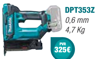
DPT353Z 0,6 mm 4,7 Kg