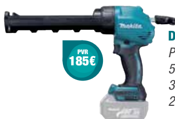
DCG180Z Pistola de silicone 5.000 N 300 ml 2,3 Kg