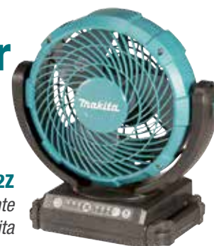
DCF102Z Ventila automaticamente 45° à esquerda e à direita 3 m/seg 1,3 Kg