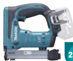
DST221Z 10-22 mm 2,4 Kg